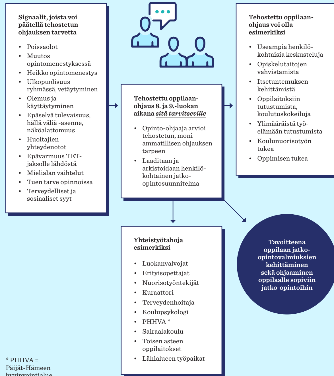
KAAVIO 1. Tehostettu henkilökohtainen ohjaus (muokattu Säkkinen-Salminen 2021 kaavion pohjalta)